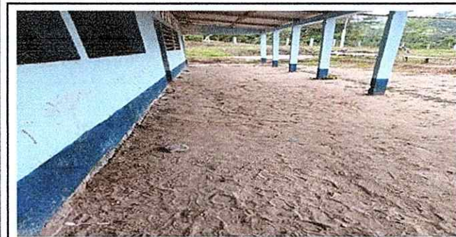
Foto 5: Colocacion de piso entortada en el corredor de la escuela.