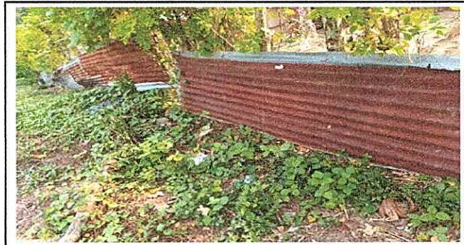
Foto 4: Terminar de colocacion de mallas alrededor del area de la escuela.