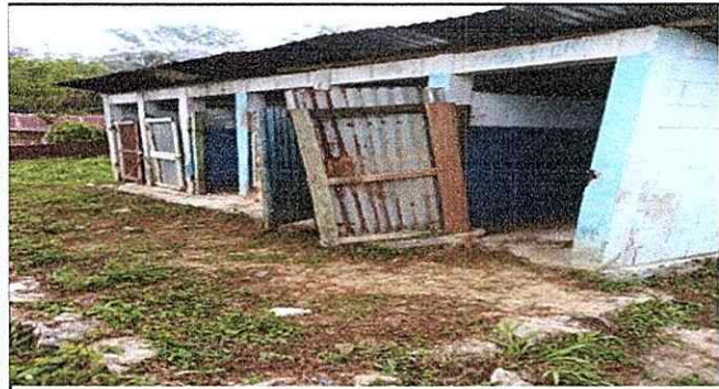
Foto1: Cambio de techo y puertas, ya no sirven,