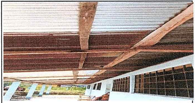
Foto 2: Csambio de laminas del techo por ser deteriorado. Con augeros.