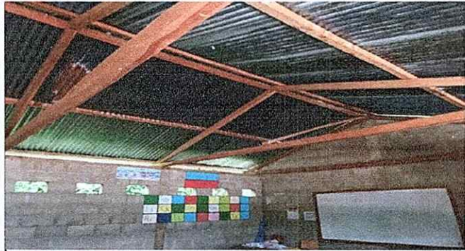
Foto1: Cambio de reglas de madera a costanera de metal.